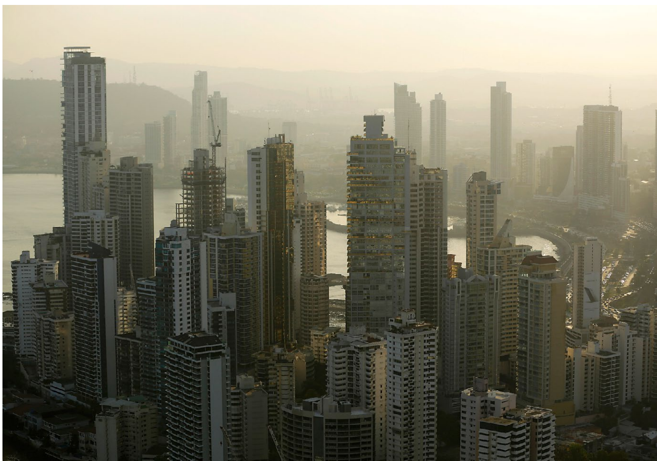
Die Skyline von Panama-Stadt. Die Stadt ist das Domizil vieler Trusts.

Jedes EU-Land muss jetzt ein Register der Eigentümer oder Nutznießer von Offshore-Konstrukten erstellen. Das bestätigte Ecofin-Sprecher François Head auf Anfrage.